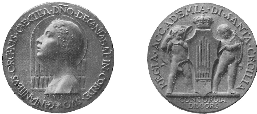
MISTRUZZI: Medaglia per la Regia Accademia di Santa Cecilia.