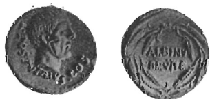
Aulo Postumio Albino Regillense - gloria di Postumii e di Roma - su monete di Postumio Albino B. f.

Sebbene annoverata tra le minores gentes , la gens Postumia fu tra le più illustri di Roma repubblicana, e con la Repubblica essa si spense. Il ramo principale, Tubertus , si diramò nell' Albus o Albinus 1 , il quale assunse il soprannome di Regillensis dopo che, nell'anno 496 a. C., il dittatore Aulo Postumio Albino, di cui vediamo l'effigie in qualche conio « familiare » 2 , sconfisse i Latini nella memoranda battaglia del lago Regillo.