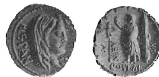
Il denario di A. Postumio Albino A. f. Sp. n. con la testa della Spagna e il civis romanus .

Ma il legittimo vanto del ripetuto magistrato monetario, erede del vittorioso console, dianzi ricordato, Aulo Postumio Albino, vanto che al medesimo piacque sfog-