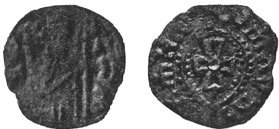
N. 7 (ingr.)

Dritto: stessa figura, con le varianti che seguono. Trono ad una sola , larga spalliera. Lo scettro si prolunga sin quasi ai piedi della figura. Il braccio destro del re è tutto rettilineo - obliquo dal basso in alto - con la mano che regge lo scettro, mentre