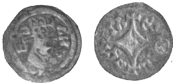
N. 4 (ingr.)

Al diritto: busto a destra con corona a quattro punte, tra le quali tre coppie di globetti. Sotto la corona, posteriormente, nastro ad uncino che s' intromette nella leggenda. Paludamento a pieghe curve che copre le spalle. Cerchio a cordone attorno alla figura; scanalatura tra questo ed altro marginale, apparentemente liscio. Leggenda: a sinistra EB (le due lettere molto nitidamente incise, e decifrabili senza possibilità di dubbio). E' da notarsi che la vo-