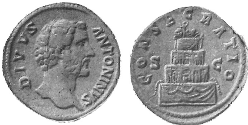
Sesterzio di consecrazione di Antonino Pio con l'altare dell'Apoteosi.

Dal succennato concetto conseguì che uomini di eccezione, distinti per valore, meriti o virtù, fossero eroizzati, deificati: nell'antica Grecia per responso di oracolo, a Roma per decreto del Senato il quale, concedendo l'estremo onore, indicava la relativa cerimonia della consacrazione o apoteosi. In