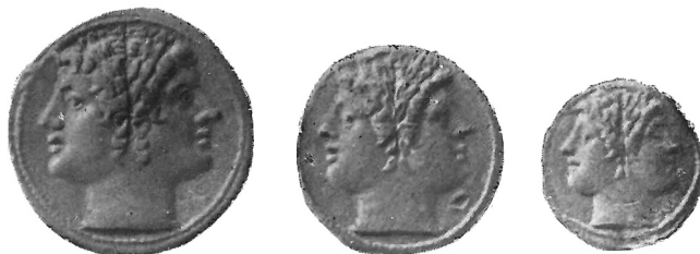
Fig. 2 (ingr.)

Credo che la chiave per la soluzione del nostro problema ci sia data dal parallelismo stabilito dallo Haeblerlin 19 , attraverso l'affinità stilistica innegabile di alcuni conii (Fig. 2), tra le serie auree di cui ci occupiamo e le emissioni argentee, di ben altra importanza e vastità, comunemente e convenzionalmente note come serie del «quadrigato». L'osservazione dello Haeblerlin permettendoci di studiare l'aureo non più isolatamente, ma col sussidio di quei dati di fatto, che uno studio condotto a parte sul quadrigato mi ha fornito 20 , ci dà modo di chia-