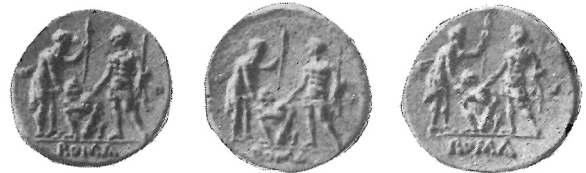
Fig. 4 ( ingr. )

I punti interessanti che l'aureo ci ha offerti sino ad ora non si arrestano a quanto si è osservato, chè una volta stabilita l'originalità ed il grado di importanza, in rapporto anche alla sua data, della scena del giuramento, di non minore interesse è, da un punto di vista metodologico e documentario, l'esame delle copie che direttamente ne derivano. A