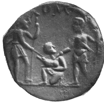
Fig. 5 (ingr.)

E' evidente anche, per motivi cronologici indipendenti - l'attività di Ti. Veturius come triumviro monetale si fa oscillare tra il 102 e il 92 a. C. 40 - che di questa ripresa del tipo originale la più antica redazione è costituita dal denario romano (Fig. 5),