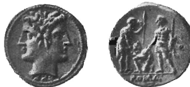
Fig. 3 (ingr.)

questi che stiamo esaminando; essi pur presentando la stessa veste tipologica se ne differenziano tuttavia, per il diverso peso (4 scrupoli contro i 6 dello statere ed i 3 della dracma nella serie esaminata) ed il segno di valore XXX apposto al dritto della moneta 26 . (Fig. 3).