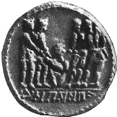
Fig. 7 (ingr.)

cosa dell' iniziale superbia del suo ritmo; analogamente è da osservare che questa volta i due avversari hanno entrambi la lancia rovesciata. E' una