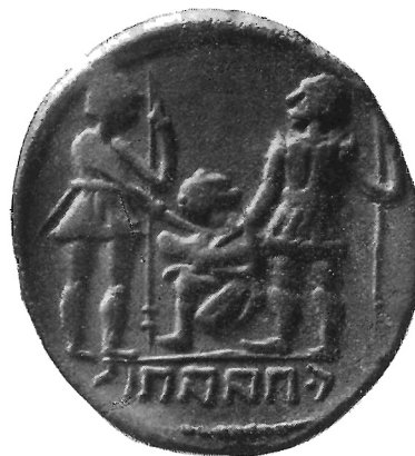
Fig. 6 (ingr.)

mediato, vigente accordo che ancora una volta stringe le stirpi italiche contro Roma. E' questo nuovo contenuto che, con uno sviluppo logico di sentimenti - rotto il patto originario, le forze collegate degli insorti, stringendosi, eliminano l'antico confederato contro cui l'inimicizia si rinnova - che vivifica e rianima la stanca ripetizione della scena sì da dar-