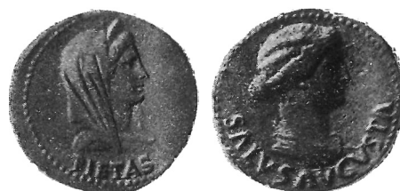
Monete di consecrazione di Livia moglie di Augusto.

Salvo casi eccezionali, le monete dell'Alto Impero con le effigi delle Auguste sono tutte postume, fatte coniare cioè dall'Imperatore dopo la morte e la deificazione delle stesse. Secondo il Lenormant ed altri, la ragione di ciò dovrebbe ricercar-