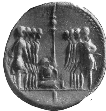
Fig. 8 (ingr.)

Roma, distaccandosi dal suo significato originale, passa a diventare il simbolo stesso della ribellione, di chi vuol ricordare la giurata fede, ed in cui il numero dei confederati cambia nelle diverse monete spostandosi da 4 ad 8. Ma con questi tipi monetali ci troviamo di fronte a delle nuove realizzazioni in quanto l' incisore col riadattarli al significato differente e con l' introdurre nuovi elementi nella scena, non copia più il modello, lo ricrea. E la nuova vita che l'immagine assume dal nuovo contenuto, se nella maggior parte dei casi non può vincere la rozzezza e l'imperizie del modestissimo incisore (Fig. 7), si afferma invece pienamente nello strano conio in cui l'affollamento è giunto al massimo (Fig. 8); così che pure attraverso l'originalità del rendimento, l'incisore italico può trasmetterci con la sua moneta, ancora una potente e appassionata voce del suo po-