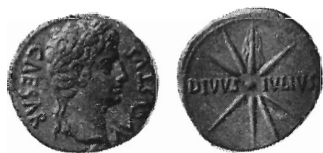
Denario di Augusto col titolo di divus raggiato da una cometa.

teti di heros e divus corrispondeva l'altro di sanctus , frequente anch'esso nella epigrafia sepolcrale e che davasi particolarmente ad alcune divinità esotiche. Quello di divus divenne poi così comune da darsi qualche volta ad Imperatore ancor vivente (Traiano); ma, di norma, non davasi se non ai defunti divinizzati. Sappiamo infatti che Augusto moriens