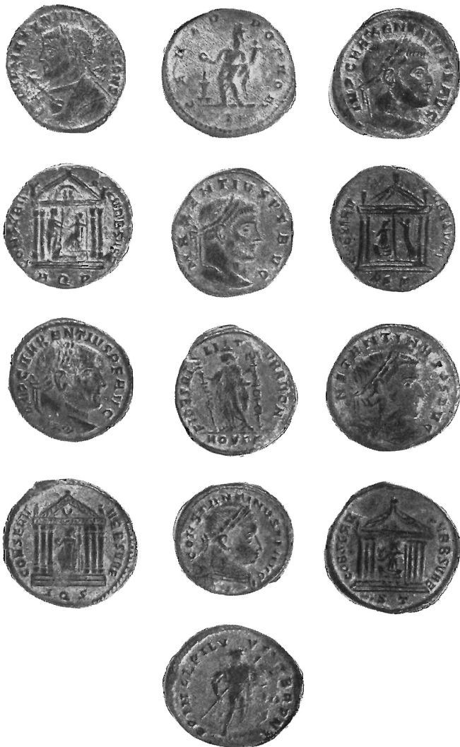
Alcuni tipi di nummi majorini del ripostiglio di Moncalieri.

di Roma sotto forma di una donna seduta a sinistra su di uno scudo tenendo un globo e uno scettro. La Vittoria in piedi a s. appoggia il piede su di un barbaro prigioniero steso a terra e porge una corona all'Urbe. Il frontone del tempio è ornato da due Vittorie porgenti corone. All'esergo P. T. Moneta coniata verso il 312 nella I a officina di Ticinum. Cohen 35. Bella.