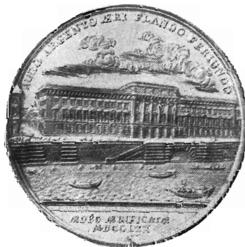
Dritto della medaglia offerta ai Sovrani d'Italia durante la visita fatta alla « Monnaie » di Parigi nel 1903. E' il rovescio di una medaglia di Luigi XV, del 1770.

Oltre a questa medaglia, coniatà in due soli esemplari, di cui uno riservato alla collezione storica della Monnaie , vennero offerti al Re due artistici scignì contenenti preziose riconiazioni di « jetons » celebri ed il Consiglio Municipale di Parigi,