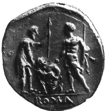
Fig. 1 (ingr.)

Prima ancora di iniziarne un approfondito esame, ci si offrono infatti, sulla base di quanto se ne