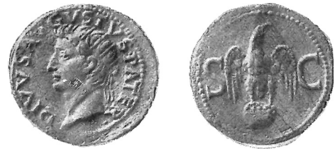
Il divo Augusto e l'aquila dalla quale è trasportato in cielo.

una Augusta. L'uccello trasvolante recava tra gli immortali il nuovo dio o la nuova dea 1 .