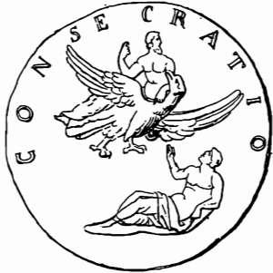
Rovescio di un medaglione di Antonino Pio. L'imperatore è trasportato in cielo mentre la Terra resta abbandonata.

Abbiamo accennato fin qui di quella istituzione di Roma imperiale, che fu la deificazione nel suo contenuto escatologico e nella cerimonia ritualistica, che tanta eco lasciò nella monetazione postuma. Ora