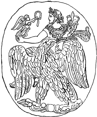
Adriano sull'aquila raggiunge il cielo recando la Vittoria e il corno dell'abbondanza (da un cammeo antico).

Sulle monete romane di consecrazione, cioè commemorative dell'apoteosi imperiale, è frequente la rappresentazione del deificato che compie il suo celeste viaggio. Monete di Augusto, Adriano, M. Aurelio, Faustina I a e Faustina II a , Sabina, Giulia Domna, Paolina, ecc., mostrano infatti l'Impera-