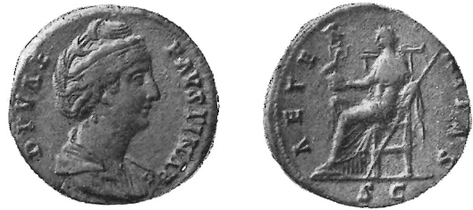
Sesterzio postumo di Faustina I; al rovescio, l'Eternità con scettro e globo sormontato dalla fenice.

Talvolta al nome del divus corrisponde, nel R/ della moneta, qualche tipo che nessuna relazione ha con la divinizzazione; così, ad es., la personifica-