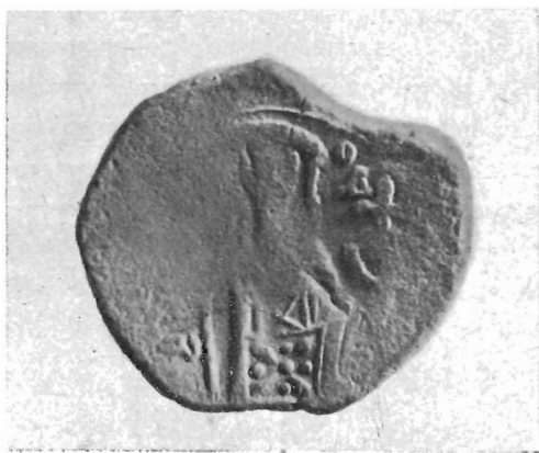
FIG. 2 (ingrandita).

Per i caratteri generali, essa si ricollega ad un gruppo di monete da noi possedute, che, come lo prova tutto il loro aspetto, sono sicuramente posteriori all'epoca dei Comneni, e al dritto ci offrono, nell'insieme, accanto alla figura dell'imperatore, l'iscrizione \omega \circ \Delta \kappa , abbreviazione del nome \text{Ἰωάννης ὁ Δούκας} , mentre nel rovescio hanno la figura di S. Demetrio. Tali pezzi sono inediti; uno eguale è però apparso nel catalogo Ratto ( Monnaies