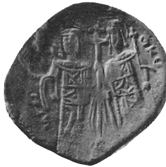
Fig. 2 bis

Si tratta di pezzi non del tutto ignoti perchè uno almeno è apparso in un importante catalogo 7 , se pur con errata attribuzione, ed altri possono esistere nella collezione di qualche nostro cortese lettore. L'identificazione non era finora avvenuta perchè gli studiosi non hanno pensato alla possibilità che i personaggi rappresentassero i due santi imperiali bizantini, e perchè probabilmente avevano a loro disposizione solo un pezzo solitario, con leggende poco chiare ed incomplete. Appena ci è stato possibile disporre di un certo numero di tali monete, alcune delle quali con iscrizioni bensì parziali ma esplicite e che si completavano fra loro, abbiamo potuto addivenire ad una interpretazione sicura. Accanto alla figura femminile, che era la più difficile da identificare, vediamo infatti con tutta chiarezza nel n. 4 la leggenda (H) ΑΓΙΑ ΕΛΕΝΗ (H); accanto a quella maschile, vediamo invece, specialmente nel n. 2, alcune lettere che richiamano il nome di S. Costantino: ⊙ , nota abbreviazione di Ο ΑΓΙΟΥ , e KO (= Kω ), inizio del nome KωΝΣΤΑΝΤΙΝΟΥ .