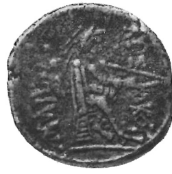
Fig. 1 (ingr.)