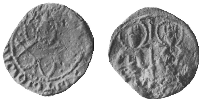
Fig. 12 bis

Il De Saulcy, seguito dal Sabatier, dal Wroth e da altri Autori propende a ritenere che tali personaggi corrispondano a Manuele II, il quale appare nel dritto, ed alla moglie Elena col nipote Giovanni VII, i quali apparirebbero nel rovescio, e che la moneta sia stata coniata all'epoca in cui Manuele II stava visitando le corti europee per chiedere aiuti contro i turchi ed aveva lasciato in patria la moglie ed affidato la reggenza dell'impero al nipote Giovanni VII 20 .