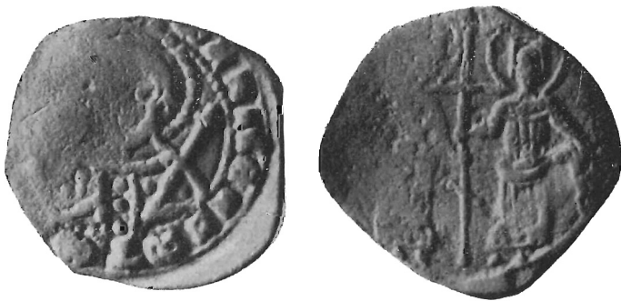
Fig. 13 bis

Abbiamo perciò lo stesso tipo di moneta al nome rispettivamente di Manuele e di Giovanni. Questo fatto induce senz'altro a pensare che l'interpretazione del De Saulcy non sia esatta poichè, se poteva forse sembrare ammissibile che, nell'assenza di Manuele II, venissero battute monete aventi la di