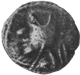
Fig. 1 (ingr.)