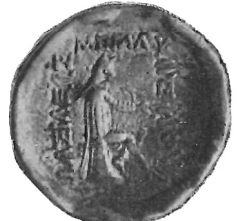
Fig. 2 (ingr.)