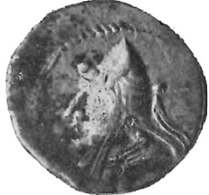
Fig. 2 (ingr.)