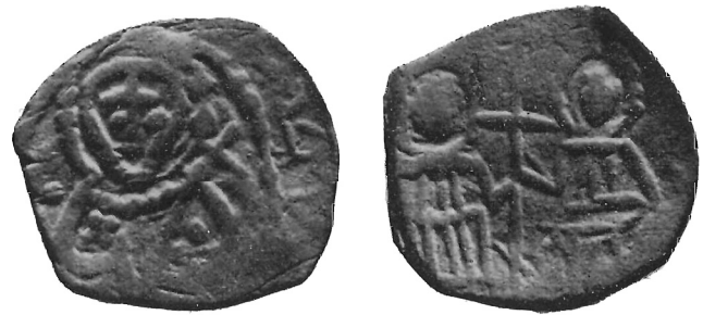
Fig. 14 bis

avute successivamente da Giovanni V 28 . La moneta andrebbe posta perciò tra il 1373 (associazione al trono di Manuele II) ed il 1391 (morte di Giovanni V).