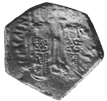
Fig. 4 bis

Diamo ora la descrizione dei vari pezzi, con la riproduzione di essi (eccetto il rov. dei nn. 7 e 9) nella tavola annessa, con numero corrispondente, aggiungendo nel testo (con numero bis ) un ingrandimento del dritto dei nn. 2 e 4 8 .