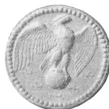
A. VI - Pel primato aviatorio - «Ali alla Patria»

A. I - LA MARCIA SU ROMA - D/. busto del DUCE a s. testa nuda - R/. Vittoria sopra fasce rivolti al sole che sorge - motto «INCIPIT·VITA·NOVA»