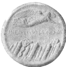
A. I - La marcia su Roma - «Incipit vita nova»