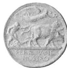
A. VI - La battaglia del grano - «Il pane nostro»