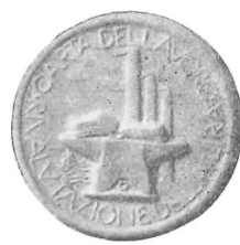
A. V - Carta del Lavoro - Rivalutazione della lira