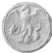
A. III - Le opposizioni vinte - «Non praevalebunt»