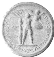
A. II - Costituzione della M. V. S. N.