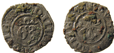
Fig. 3. Denaro di Gian Galeazzo Visconti (1395-1402).