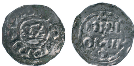
Fig. 1. Denaro di Ugo di Provenza e Lotario II (931-950).