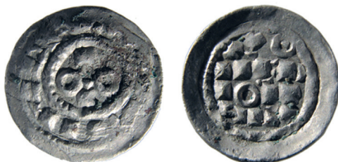
Fig. 2. Denaro di Ottone I o III di Sassonia (973-1002).

Come per altre zone della città (ARSLAN 1991, pp. 91-92 e 2004, p. 95), la documentazione di materiale numismatico nell'area, che si era interrotta con un decanummo di produzione gota della metà del VI secolo d.C. (cfr. supra , p. 128), riprende dunque con il ritrovamento di denari di età altomedievale. Tale nominale in argento, introdotto da Carlo Magno con la riforma del 794, che segna l'inizio della monetazione medievale europea, già nel corso del IX secolo aveva subito una progressiva riduzione del suo contenuto metallico. L'esemplare più antico (fig. 1), dalla terra di riempimento relativa alla fossa di asportazione della tomba 1664 (UC VII; US 1606/3; 1,15 gr; 21 mm), venne battuto nella zecca di Mediolanum nel breve periodo di reggenza del regno di Italia da parte di Ugo di Provenza e del figlio Lotario II, fra il 931 e il 950 (CNI V, p. 37, n. 1; CHIARAVALLE 1983, p. 92, n. 136). Privo di elementi iconografici, se si escludono le croci che compaiono nelle scritte, menziona sul diritto i nomi reali, disposti intorno alle lettere Y e X, iniziali di Gesù Cristo, mentre il rovescio è occupato dalla sola indicazione onomastica della zecca.