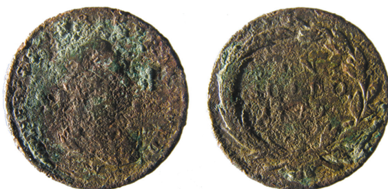
Fig. 4. Soldo di Maria Teresa d'Asburgo (1779).

nel settore UC I (US 122) è un denaro in mistura (titolo al 165‰; 0,51 gr; 14 mm; CRIPPA 1986, p. 90, n. 16/A), coniato fra il 1395 e il 1402 da Gian Galeazzo Visconti, duca di Milano e di Verona, come recita la scritta posta sul diritto intorno alle lettere G e Z del nome ducale (fig. 3). Al centro del rovescio è una croce gigliata, circondata dalla legenda COMES VIRTVTVM, titolo assunto da Gian Galeazzo in seguito al matrimonio con Isabella di Valois nel 1360.