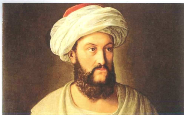
Ritratto di Johann Ludwig Burchkardt (1784-1817), l'orientalista svizzero scopritore della capitale dei Nabatei (fonte: web)

Le prime monete battute entro i confini del regno nabateo, forse fra la seconda metà del III e gli inizi del I a.C., sono costituite da esemplari in bronzo, spesso di fattura assai modesta (fig. 2), contraddistinti da una testa femmi-