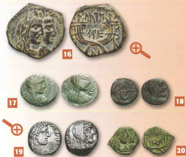
16 - Classical Numismatic Group, Electronic Auction 215, 288 (mm 17)

Gli innumerevoli ritratti femminili che ci sono stati consegnati dalla monetazione nabatea non permettono in realtà di conoscere nemmeno i volti delle sovrane. Seppur così frequentemente impressi sul numerario, vennero infatti fissati in una ripetitività iconografica che impedisce di cogliere un qualche accenno di uno stile un poco personale. Diversa è la rappresentazione dei ritratti maschili, che contraddistinguono, per esempio, Obodas III con una pettinatura a stretti boccoli, mentre Aretas IV e Malichus II sfoggiano lunghe chiome appena mosse sciolte sul collo, che diventano con Rabbel II una capigliatura fluente sulla schiena, ben oltre le spalle. Aretas IV, nel corso del secondo matrimonio, Malichus e forse anche Rabbel esibiscono pure corti baffetti, talora lievemente rivolti all'insù. Anche i ritratti monetali femminili nabatei, inoltre, soggiacciono a quella mascolinizzazione delle sembianze, alla