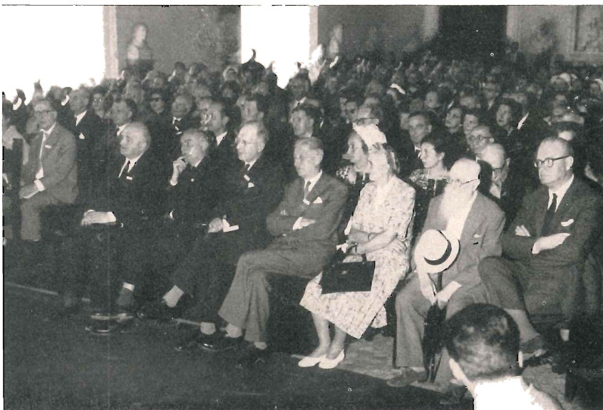
Cerimonia inaugurale del Congresso Internazionale di Numismatica

ed a Villa Adriana. La chiusura dei lavori del Congresso ha avuto luogo presso l'Istituto di Archeologia nella facoltà di Lettere all'Università.