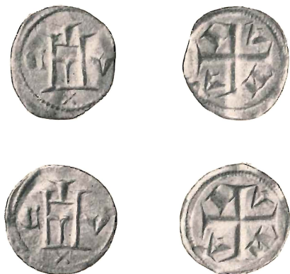
Figg. 6 e 7.

20 denari non sarebbe l'unico esempio della zecca di Genova, ch  negli anni dal 1631 al 1635 vennero coniate appunto monete da 20 denari del vecchio tipo e tra il 1643 ed il 1645 altre monete da 20 denari al tipo della Madonna (64) . Se l'ipotesi corrispondesse alla realt  si avrebbe un'ulteriore predatazione dell'ottavino e delle prime quartarole anche sulle date del De-