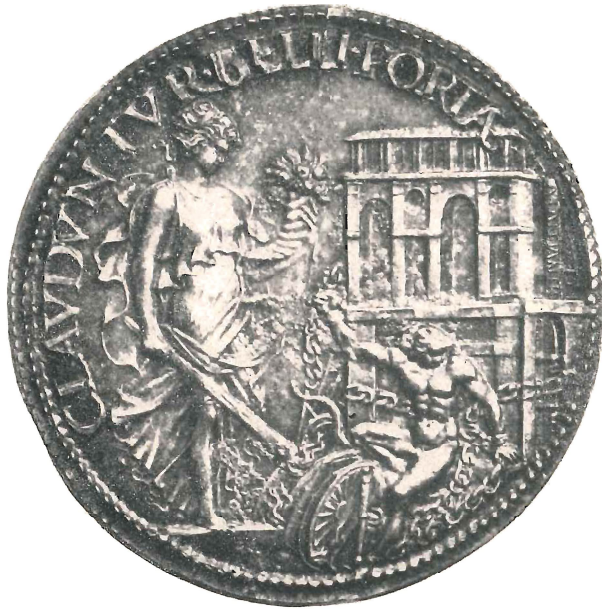
Fig. 2 (doppio dal vero)

simili (Camesasca). Delle prime due medaglie non si trova assolutamente alcuno cenno nella Vita del Cellini; per quello che si riferisce alla terza esisterebbe solo la notizia che egli venne richiesto dal duca «di un bel ritratto, come io aveva fatto a papa Clemente»; ma egli aggiunge però semplicemente che «cominciai il diritto ritratto in cera», e non risulta che sia mai andato oltre.