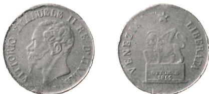
Vittorio Emanuele II - 5 centesimi 1866 - Progetto di rame.

Il diritto, con la testa del Re rivolta a destra, è quello stesso che figura al n. 370 del Pagani Prove; mentre il rovescio, con la parola PROVA in circolo a sinistra, è quello che figura al n. 371 dello stesso volume. Fa parte della serie di prove intese alla realizzazione della nuova progettata moneta da 5 centesimi in lega di ferro-nichel, che poi, com'è noto, non ebbe seguito. Proviene dalla collezione Celati.