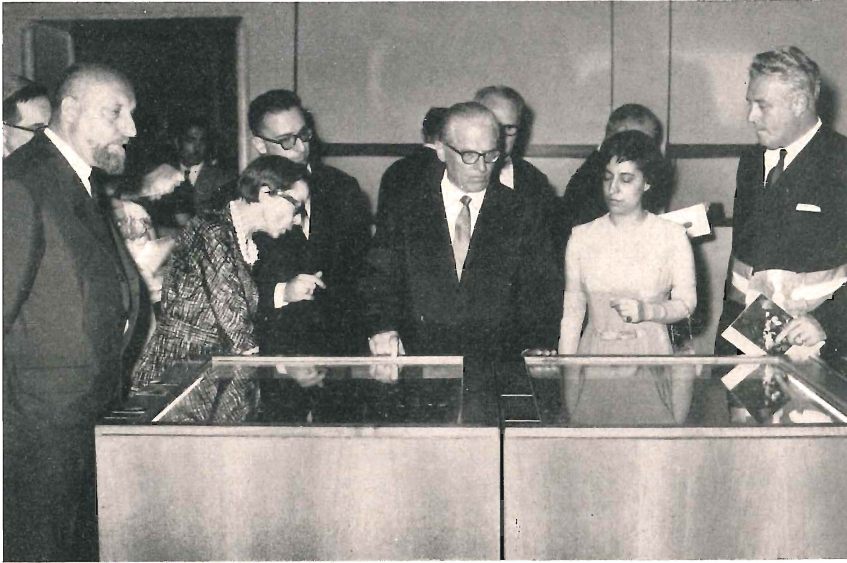
S. E. Gronchi osserva le raccolte numismatiche a Palazzo Rosso

bella conservazione il rarissimo pezzo da 8 reali del 1715, detto anche scudo dell'Unione.