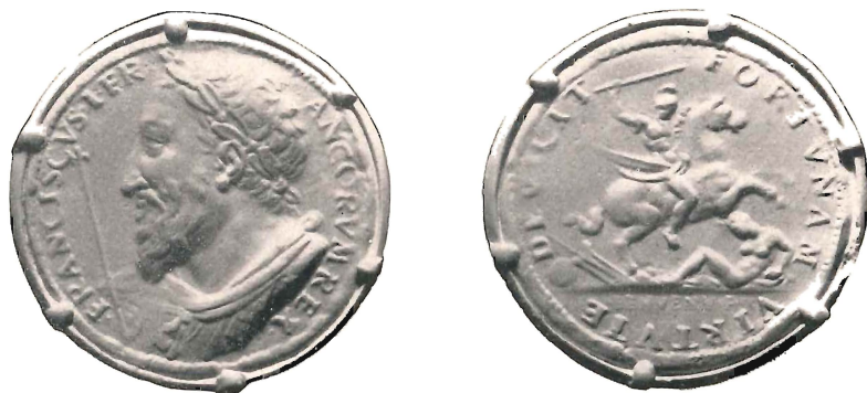
Fig. 4 ( al vero )

Prima di tutto il Cellini non fa, nei suoi scritti, alcun cenno, neppure vago, a tale medaglia. E la cosa appare particolarmente strana non solamente per l'accuratezza con cui egli, di