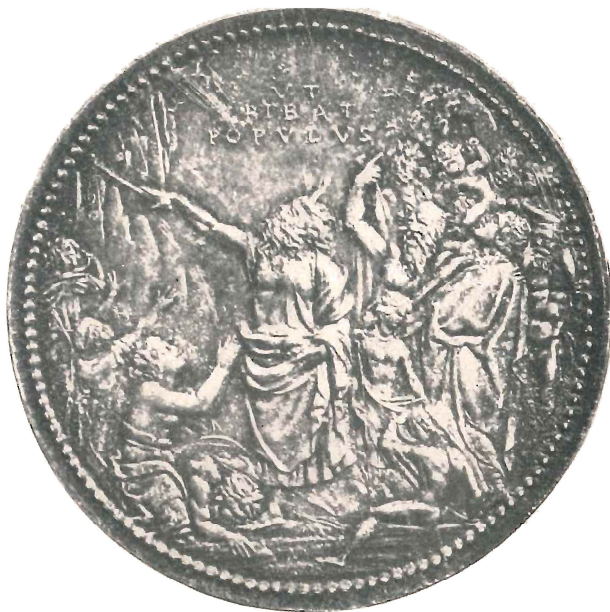
Fig. 3 ( doppio dal vero )

viene attribuita: questa porta l'effigie del Bembo con lunga barba fluente, e la scritta PETRI BEMBI CAR; invece il Cellini dice esplicitamente che, all'epoca in cui lo ritraeva, il Bembo portava « la barba corta alla veneziana »; e si sa inoltre che, nel 1537, il Bembo non era ancora cardinale. Quanto al rovescio, nella medaglia attribuita al Cellini il Pegaso non è circondato da alcuna ghirlanda. E' quindi evidente (anche indipendentemente da ragioni stilistiche) che questa medaglia non ha nulla a che fare con quella di cui ci parla il Cellini; medaglia, del resto, che egli in nessun punto dei suoi scritti dice di aver mai condotta a termine. Il ritenere che essa sia un « rifacimento » celliniano più tardivo (Armand) è del tutto arbitrario; talché ben fecero, a nostro giudizio, Arneth, Habic, Camesasca ad eliminare essa pure dalle opere del Cellini, e ad includerla fra le « attribuzioni ».