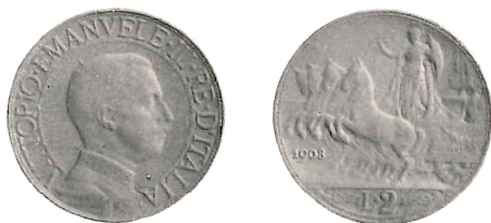
Vittorio Emanuele III - 2 lire 1908 - Prova d'argento patinato.

all'avv. Celati dal cav. Viti Giovanni, incisore presso la R. Zecca, nel 1924.