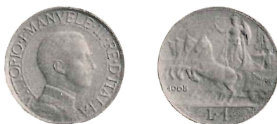
Vittorio Emanuele III - Lira 1908 - Prova d'argento patinato.

Battuta con gli stessi conii della moneta normale (Pagani 1045), rappresenta un esperimento — che non ebbe poi seguito — fatto dalla Zecca per studiare una più artistica presentazione della nuova moneta. Manca anche nella raccolta ex-reale. Proviene dalla collezione Celati.