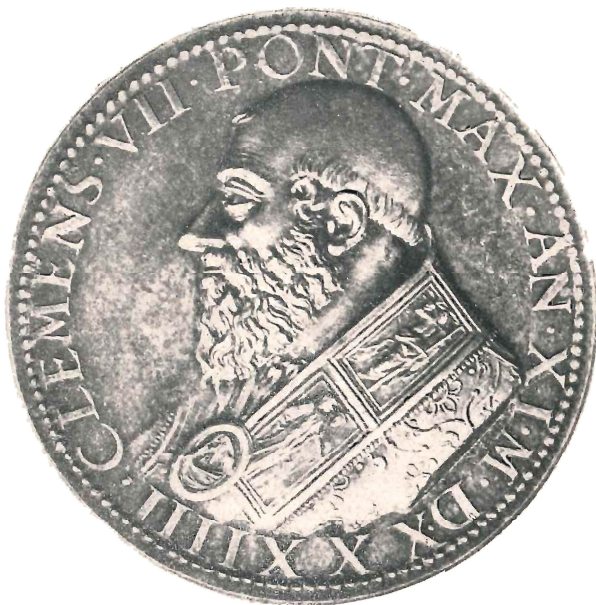
Fig. 1 (doppio dal vero)

suoi scritti, o non corrispondono alla descrizione che egli stesso ne dà, talchè l'attribuzione appare per tutte più o meno discutibile.