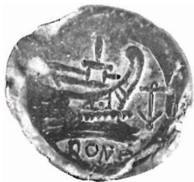
Assi del secondo tipo