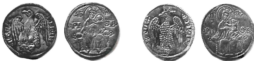
Figg. 5 e 6 - Grossi maggiori (al nome di Federico)