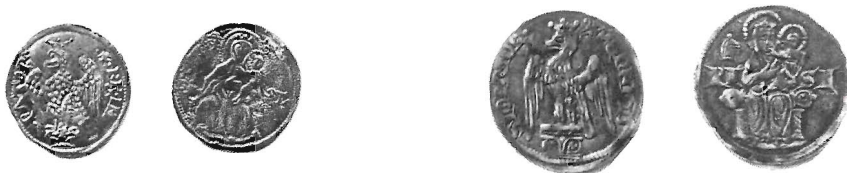
Fig. 7 - Bianco (al nome di Federico) Fig. 8 - Grosso minore (al nome di Enrico)

Il facile ritrovamento dei primi bianchi pisani ci orienta verso una coniazione copiosa e di larga diffusione.