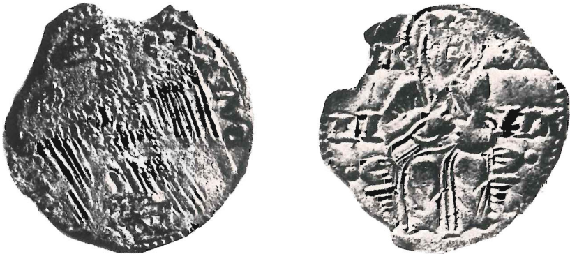
Fig. 2 - Imitazione dello stesso (I esemplare).