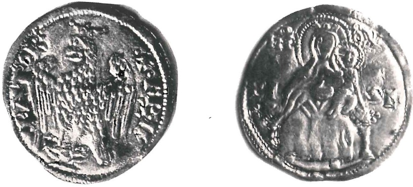
Fig. 1 - Bianco di Pisa.