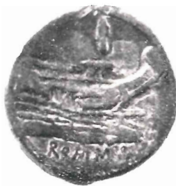
Assi del primo tipo