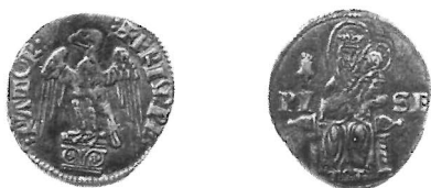
Fig. 4 - Grosso minore (al nome di Federico)

Nelle riproduzioni a grandezza naturale che seguono, sono posti a raffronto il grosso minore , i due grossi maggiori (con l'aquila coronata e non coronata) ed il bianco della serie in esame (Figg. 4, 5, 6 e 7); nonchè il grosso minore al nome di Enrico (Fig. 8).