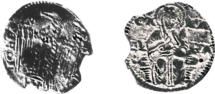
Fig. 3 - Imitazione dello stesso (II esemplare).